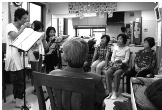
回想的活動をしています

今、来てくださっている利用者のほとんどは、上飯田南町、東町、北町のご近所に住んで見えます。利用者さん同士が元々知り合いだったり、話し始めて、共通の知り合いがみえたりもします。そんなわけで、まだ人数は少ないですが、ほのぼのとしていて、のんびり、あったかい、笑い声のはじけるデイ東町となりそうです。