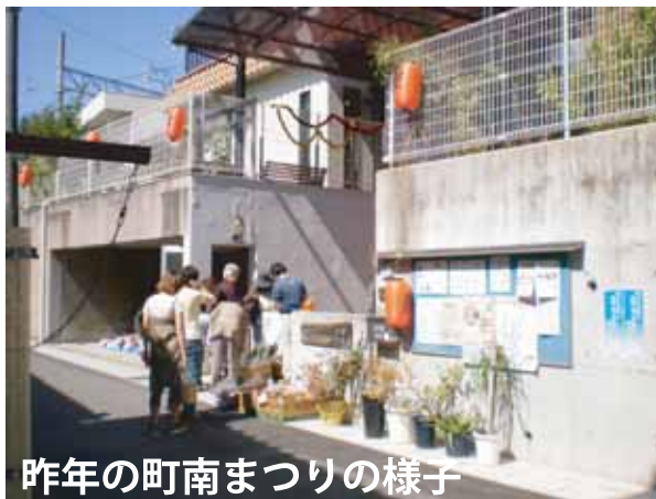
昨年の町南まつりの様子