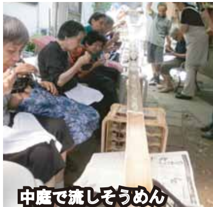
中庭で流しそうめん